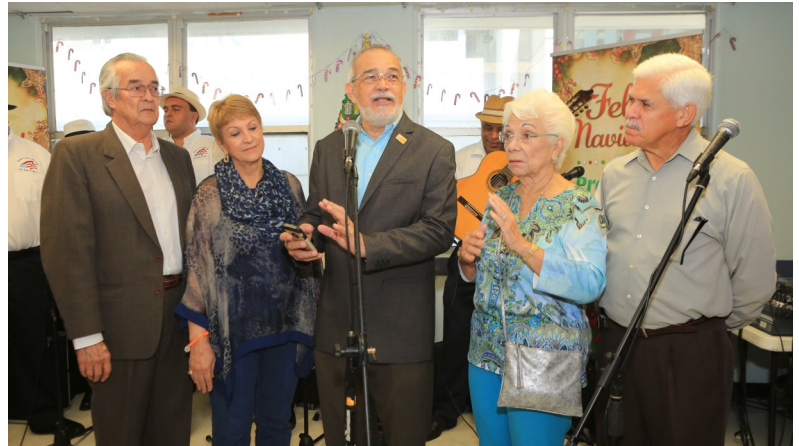
La Junta de Directores de la Liga Puertorriqueña Contra el Cáncer dan la bienvenida a todos los presentes, empleados e invitados.