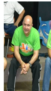
Hon. Eduardo Cintrón, Alcalde del Municipio de Guayama.