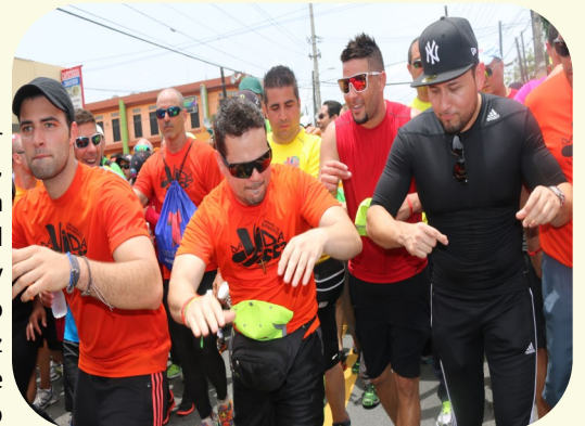
El actor Jencarlos Canela, Carlitos de Día a Día, con el cantante y "coach" Roberto Tapia de la Voz Kids de Telemundo