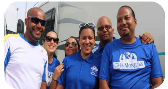
Empleados de Tres Monjitas.