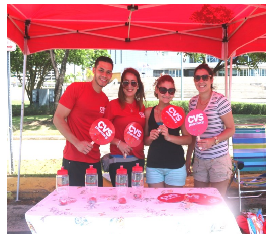
El equipo de CVS Pharmacy