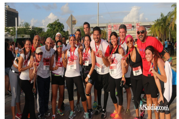
Los artistas que participaron en Camínalo o Córrelo.