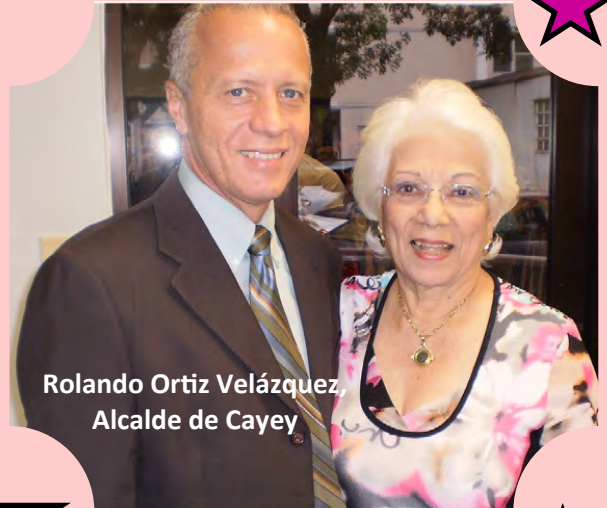
Rolando Ortiz Velázquez, Alcalde de Cayey