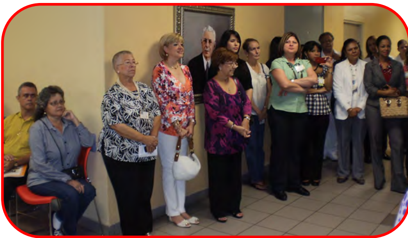
Celebrado en el vestíbulo del Hospital.