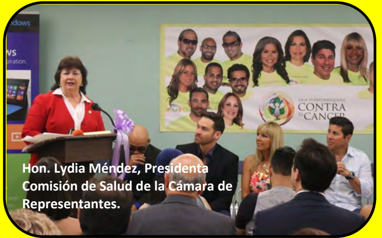
Hon. Lydia Méndez, Presidenta Comisión de Salud de la Cámara de Representantes.