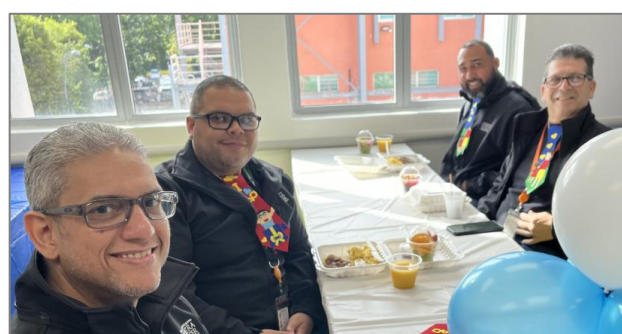
Desayuno para los padres que laboran en el hospital