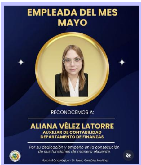
Compañeras con desempeño sobresaliente

El hospital fomenta un entorno de bienestar para sus empleados. Esto responde al objetivo estratégico de fortalecer sus capacidades y su nivel compromiso para el ofrecimiento de servicio humanizado y sensible. La institución fomenta iniciativas mensuales para educar y promover estilos de vida saludables, para reconocer líderes y empleados con desempeño sobresaliente, y para celebrar logros, festividades y fechas memorables. El bienestar del personal es fundamental para garantizar la prestación de servicios de salud de excelencia, calidez y compromiso hacia cada paciente y su familia.